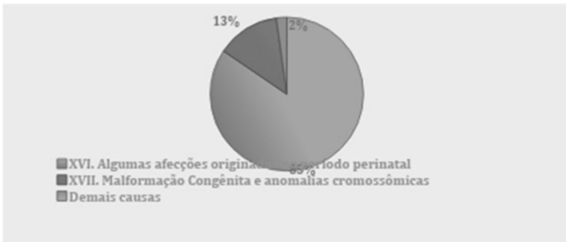
Gráfico 3. Frequência de Óbitos Perinatais segundo Causa (CAP. CID-10), Ceará, 2024.

Fonte: SESA/SEVIG/COVEP/CEVEP/SIM/GT Vigilância do Óbito. Nota: *dados parciais gerados em 05/05/2025, sujeitos a alteração